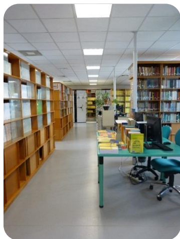
La Bibliothèque du LMA