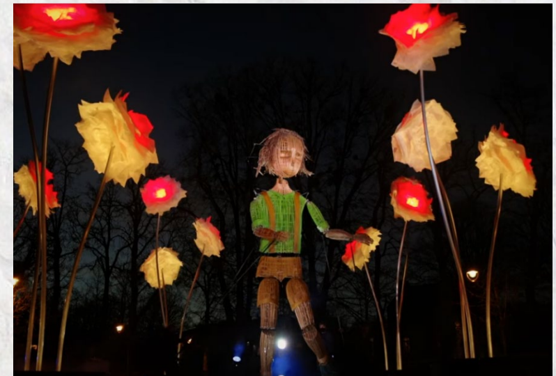
© Production « le rêve de Lili » : compagnie l'Homme debout avec le soutien de la Ville de Poitiers

Pour fêter la nouvelle année, la compagnie l'Homme debout et de nombreux habitants de Poitiers, Grand Poitiers et de toute la France, se réunissent virtuellement dans une danse collective autour de la marionnette géante Lili, rappelant les gestes barrières.