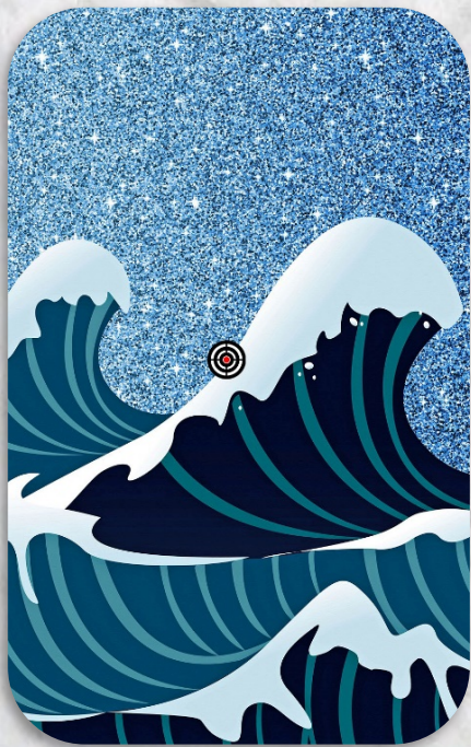
AnnaliseArt (Pixabay), AJ (2020)